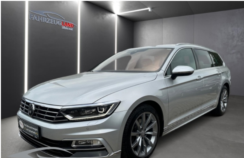
FAHRZEUGLAND Südwest www.fahrzeugland.com Tel.: 07631 - 974740