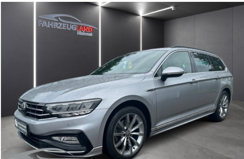
FAHRZEUGLAND Südwest www.fahrzeugland.com Tel.: 07631 - 974740